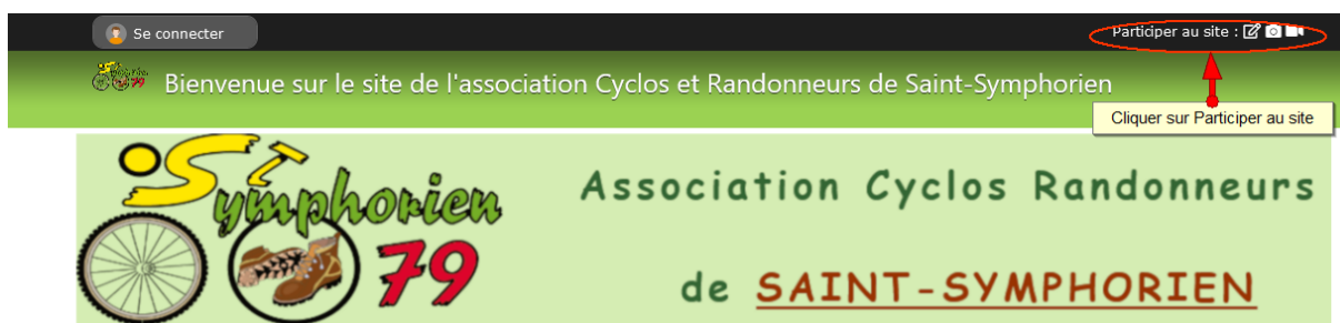
Figure 1: Cliquer sur Participer au site en haut à droite

Pour ce faire, depuis la page d'accueil sur site https://www.acr2s79.fr/ , il faut cliquer sur « Participer au site » :